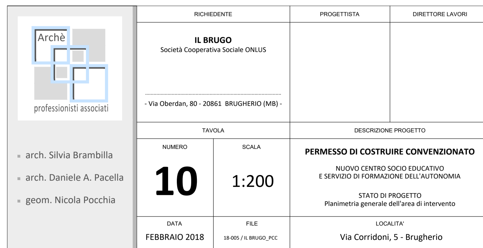
PLANIMETRIA GENERALE DELL'AREA DI INTERVENTO - SCALA 1:200