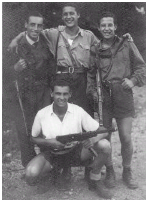
Con un gruppo di suoi compagni. (il primo in alto a sinistra)