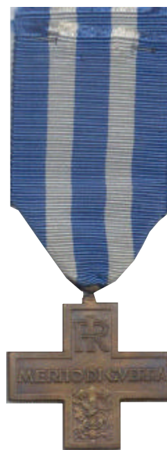
La croce al merito di guerra