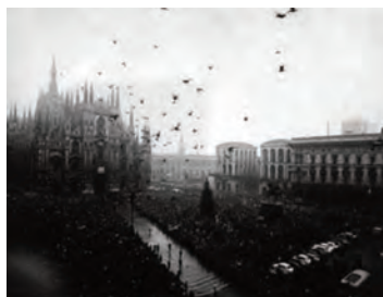
Piazza Duomo: i funerali per la strage del 12 dicembre